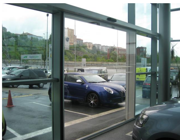
Puerta derecha interior