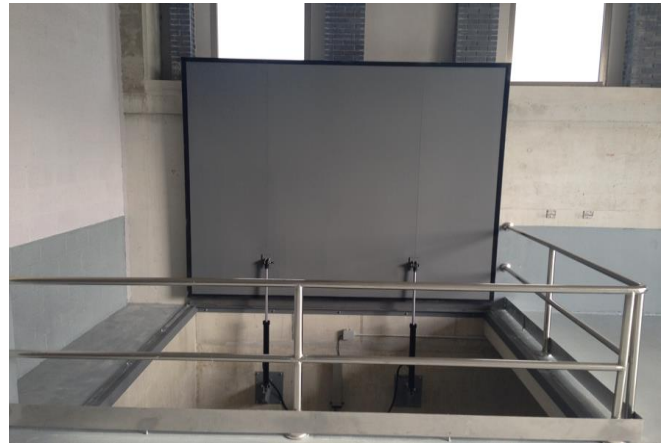
TRAMPILLA HERMETICA AUTOMATICA